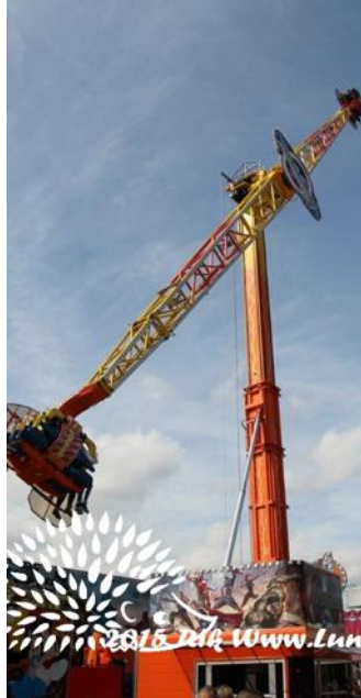
Le Booster Avengers fera escale à Rosheim.

Petits et grands se retrouveront également pour partager des moments conviviaux lors de la fête foraine qui se déroulera du 10 au 14 septembre