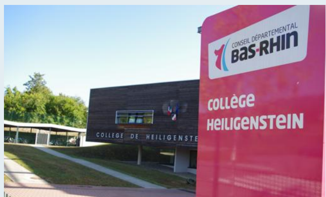
Le nouveau nom du collège de Heiligenstein ne règlera pas toutes les confusions.