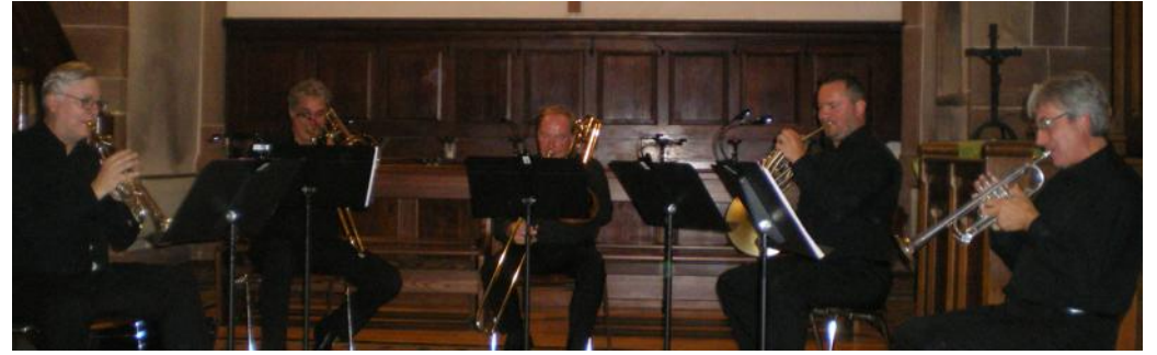
La brillance des cuivres a été à l'honneur.

« L'orgue Mahler étant d'esthétique alsacienne, à partir de là, nous proposerons cette année